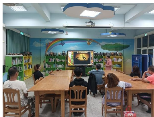
參與的家長都非常專心地聆聽