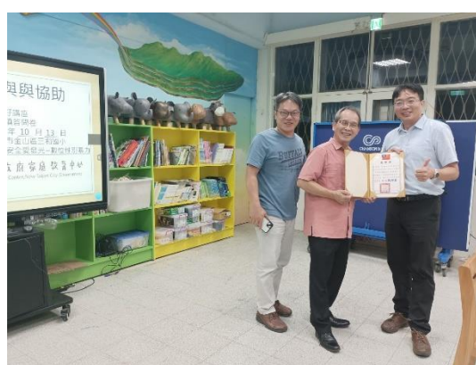
校長頒發講師感謝狀